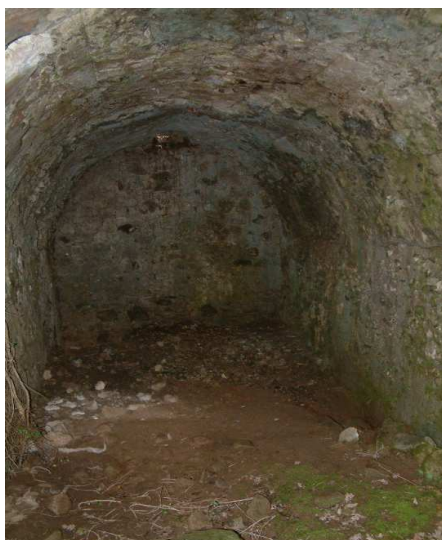
Figura 4 Interno della cisterna