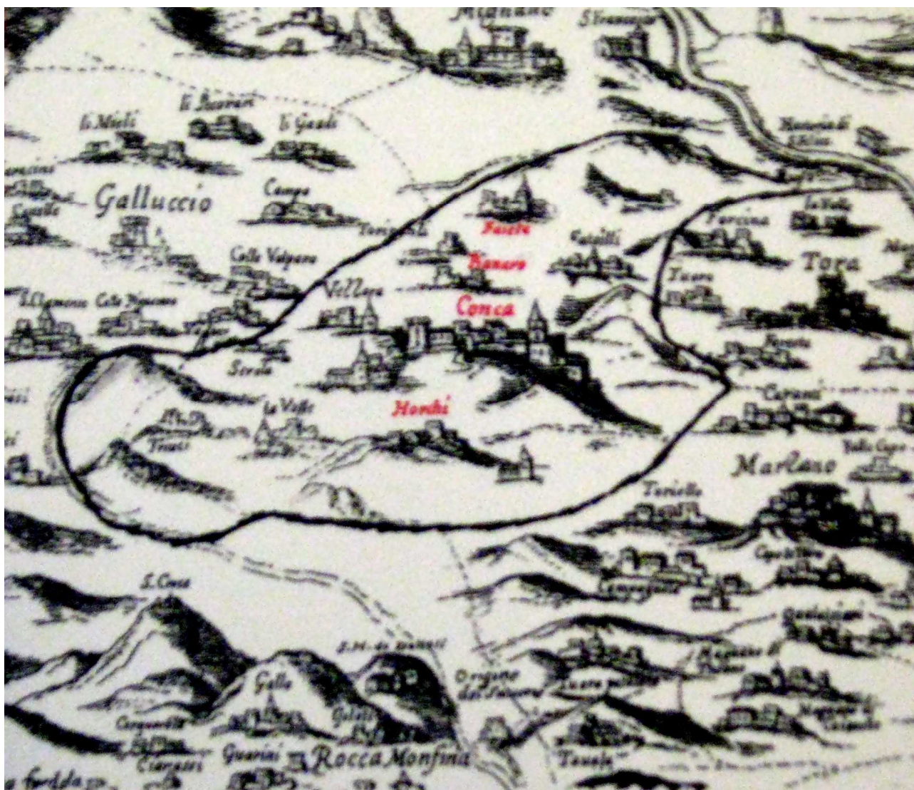
Figura 6 (Stralcio della Carta del De Guevara del 1635)

La mia seconda ipotesi di percorso vede Castrum Pilanum ubicato sulla pianura de La Valle , prospiciente il fiume Pubbico così come si potrebbe evincere da una cartina topografica elaborata nel 1635 dalla Diocesi di Teano ( detta del De Guevara ) e molto diffusa dalle nostre parti.