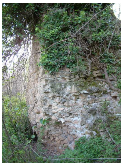
Figura 5 Parte del muro perimetrale

Castel Pilano, appare come un fortilizio antico, un castrum , appunto